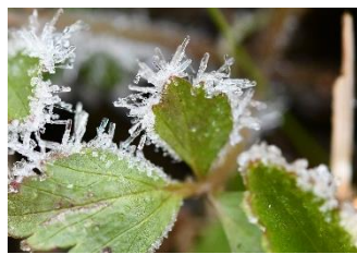
冬は葉も凍りつく寒さ

ただ、8月10日(月)の午後2時に玄関前が36.5度、ミニ彩湖が38.1度でしたので、測った時間によっては、逆転すると思われます。