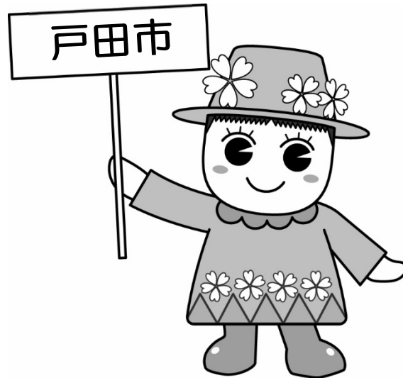
戸田ヶ原自然再生キャラクター とだみちゃん