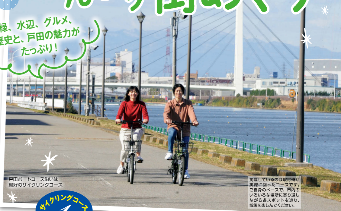
戸田ポートコース沿いは、絶好のサイクリングコース

掲載しているのは取材班が実際に回ったコースです。ご自身のペースで、市内のいろいろな場所に寄り道しながら各スポットを巡り、散策を楽しんでください。