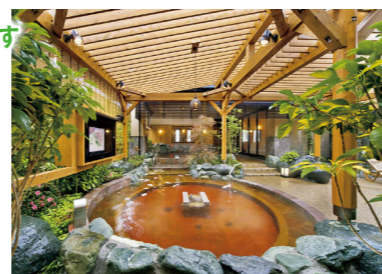
露天の岩風呂は約41.5℃。大型テレビも設置されている