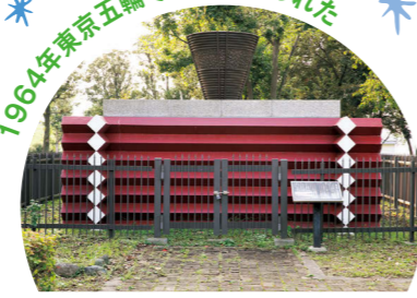
当時の国立競技場のものと同じデザインで3分の2の大きさ