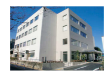
1・2階の多世代交流館の愛称は「さくらバル」