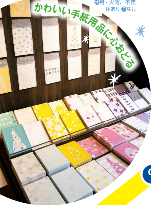
カラフルな便せんのディスプレイが目を引く