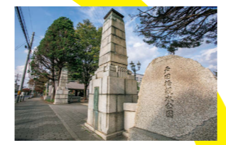
この柱はオリンピックなど戸田の歴史を見守ってきた