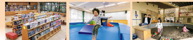
図書室の机スペースは勉強や未就学児向けの多目的ホール。屋内砂場にはおもちゃもあり。裸足で入ろう