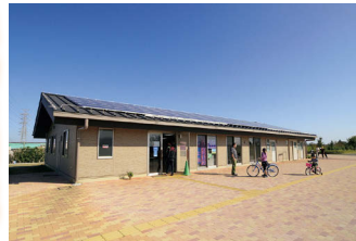
●管理棟にはロッカーやシャワーも完備