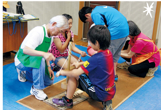
●「こども体験ひろば」の講座で人気の火おこし体験