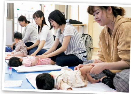
●ベビーオイルマッサージ体験会。親子向けのイベントも充実

●児童センターと屋外に「4つのゾーン」を設置した大型施設。センター内は未就学児向けのエリアはもちろん、ロッククライミングや軽体育室など小学生以上の子どもも思いきり遊べる設備がいっぱい。屋外でも、気分に合わせてエリアを使い分けられて楽しい。