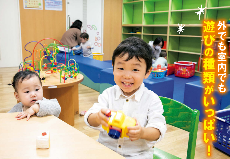
●プレイルームには知育玩具多数。授乳室やトイレもある