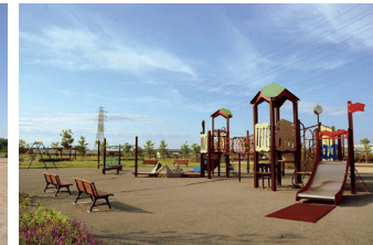
●アスレチック広場も併設されている