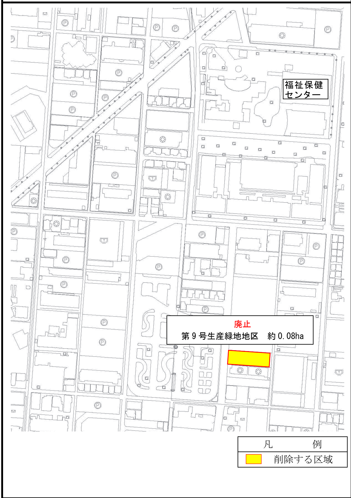
第9号生産緑地地区（計画図6）