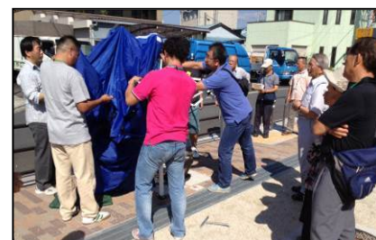
マンホールトイレのテント。一人で組み立てるのはとても時間がかかる