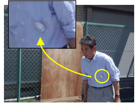
市長も来てくださり、クイズや缶バッジ制作を楽しみました！