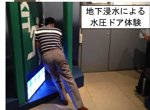
地下浸水による水圧ドア体験