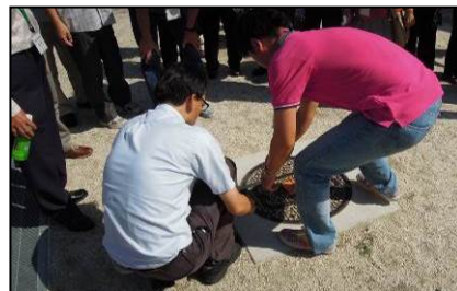
トイレの開け方にも、専用の道具とコツがある。