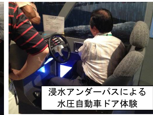
浸水アンダーパスによる水圧自動車ドア体験