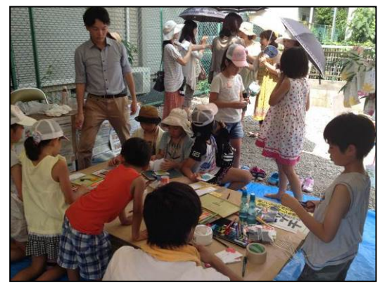
たくさん子ども達が、オリジナル缶バッジづくりに参加してくれました！

「川岸児童遊園地に関するクイズ」、「三角くじ」、「公園一言エール短冊づくり」、「缶バッジ制作」を行いました。 多数のご参加ありがとうございました。