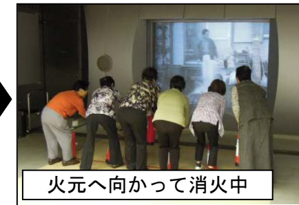
火元へ向かって消火中