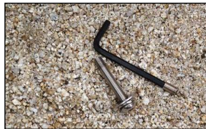
六角レンチなどの道具、カマドや煮炊きの道具はどう管理する？