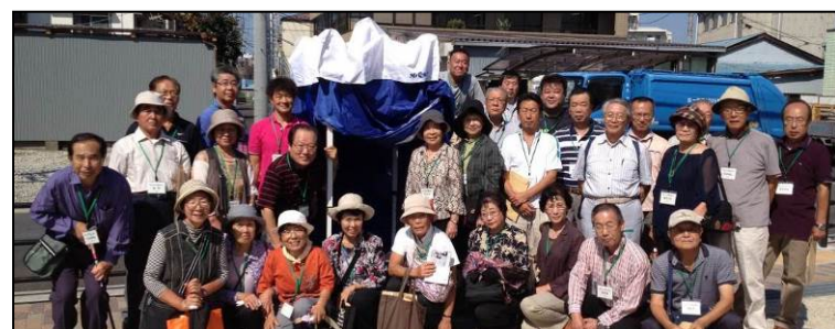
写真：関原一丁目ここにこ児童遊園にて、防災施設の組立体験を行いました！