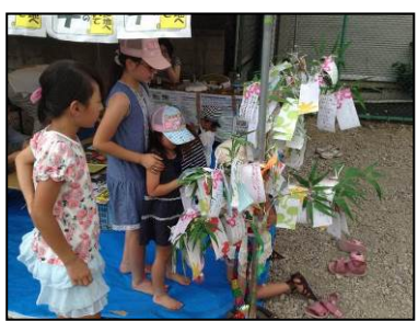
短冊づくりの様子