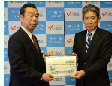
(上) 協議会・長坂会長、 (下) 川岸町会・大山会長 両会長より市長へ改善計画案を提出