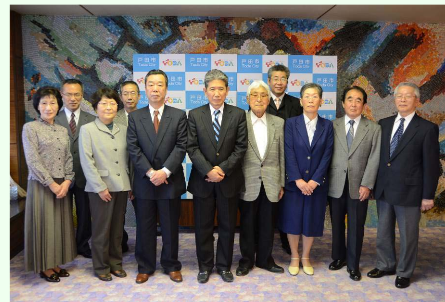
川岸地区まちづくり推進協議会、川岸町会を代表して各5名ずつ、計10名で報告してきました。