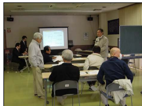
住まい・建替え相談会

今後も、災害に強いまちづくりを目指し、住市総事業を進めてまいりますので、ご理解とご協力の程、よろしくお願いいたします。