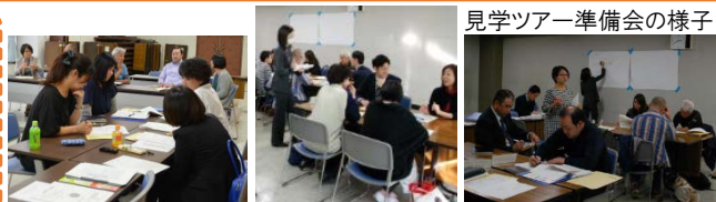
見学ツアー準備会の様子