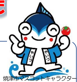
焼津市マスコットキャラクター

人生 100 年時代に向けて、安心して心豊かに暮らしていくために“今できること”や“これからやりたいこと”をみんなで語り合しましょう!!