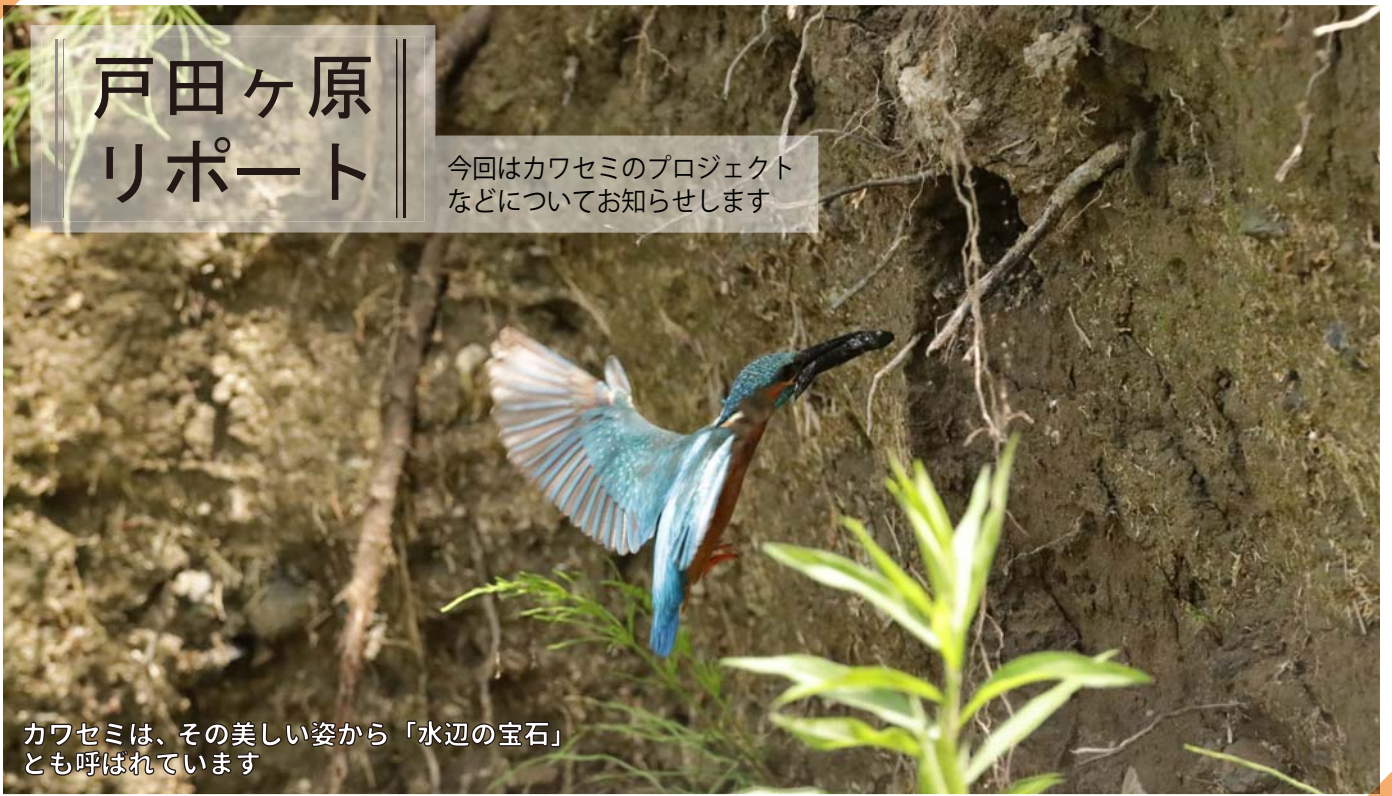
カワセミは、その美しい姿から「水辺の宝石」とも呼ばれています