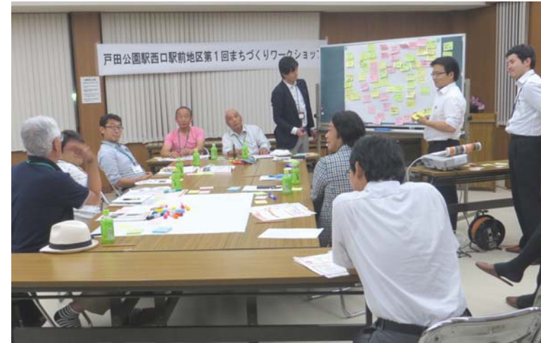
たくさんのご意見をもとにキーワードを考えました

グループワークで出された意見は、専門家のアドバイスを受けながら、その意図や理由から似ている意見同士でグループを作成しました。そして、それぞれのグループを一言で言い表せる キーワード を考え、まちづくりの方向性としてしました。