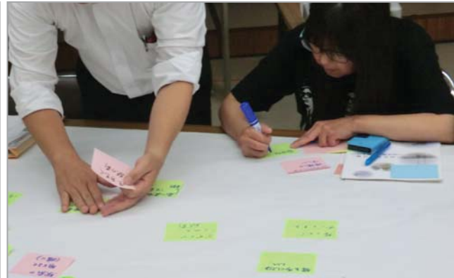
それぞれの想いをふせんへ書き出しました

② 各々が思い描いた将来像のイメージを全員で共有し、まちづくりの方向性を確認するため、参加者同士で グループワーク を行いました。