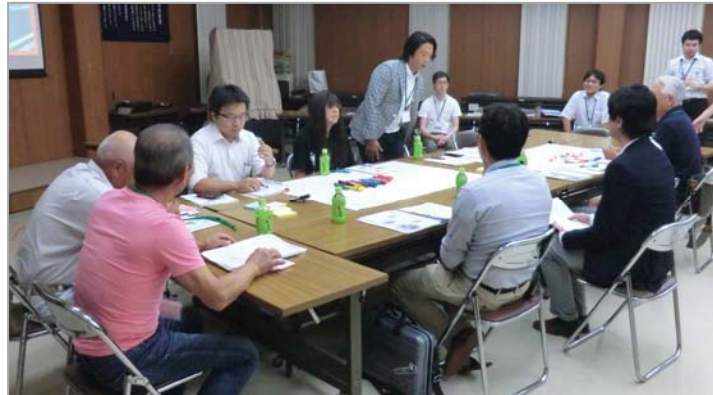
はじめに自己紹介をしました

① 第1回まちづくりワークショップでは、意見交換に先立ち、戸田公園駅を中心とした「 うるおいのある生活拠点 」の形成に向けて、戸田公園駅西口駅前地区について「こんな駅前になったらいいな」という 将来像のイメージ について、意見を出し合いました。