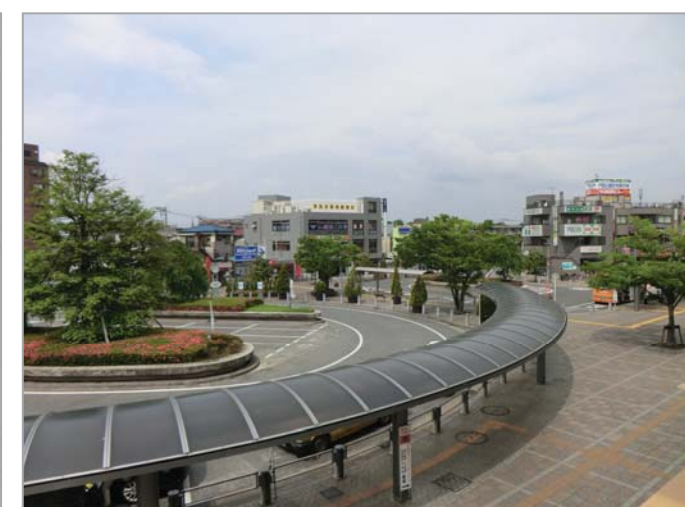
現在の戸田公園駅西口駅前の様子