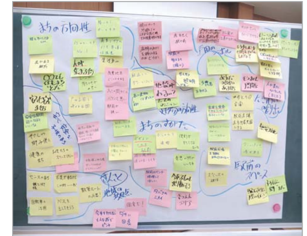
グループワークで集まったご意見