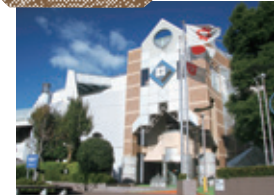
児童センター プリムローズ

子どもが自由に利用できる施設です。毎月、絵本の読み聞かせや工作・パソコン講座などさまざまなイベントを開催。お母さん同士が交流できるスペースもあります。