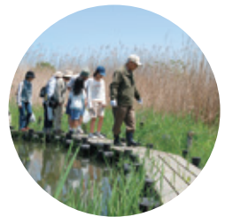
彩湖自然学習センター

自然を満喫できる博物館です。バードウォッチングや昆虫採集、植物の観察など、講座やイベントも随時行っています。