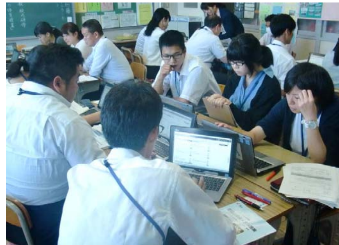
ワークショップ形式