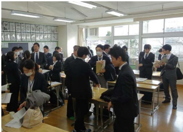
ワールドカフェ形式