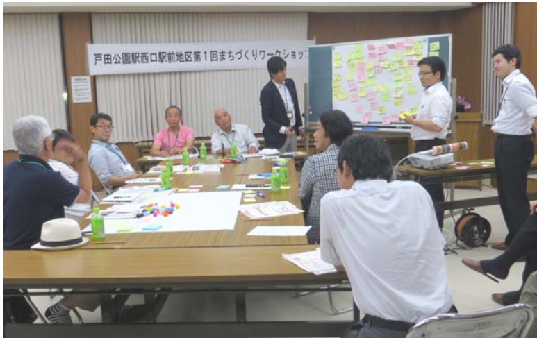
たくさんのご意見をもとにキーワードを考えました

グループワークで出された意見は、専門家のアドバイスを受けながら、その意図や理由から似ている意見同士でグループを作成しました。そして、それぞれのグループを一言で言い表せる キーワード を考え、まちづくりの方向性としてしました。