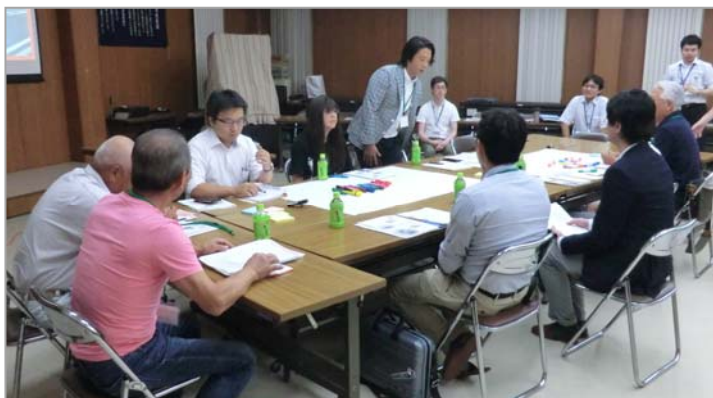
はじめに自己紹介をしました