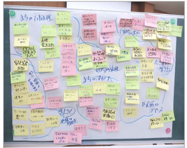
グループワークで集まったご意見