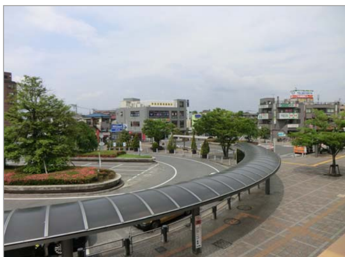
現在の戸田公園駅西口駅前の様子