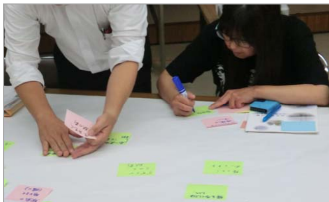
それぞれの想いをふせんへ書き出しました