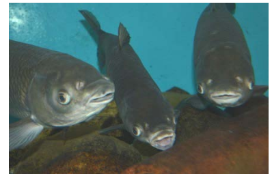
巨大な魚たちがお出むかえ。エサをねだっているのかな？

まずは、一番人気の1階から。ここは彩湖や荒川に生息する魚たちを展示しているミニ水族館です。1階はエサの時間に合わせた来館がお得！大水槽の魚たちが一斉にエサを食べる様子は迫力満点です。カメの散歩（不定期）に出会ったらラッキー。カメとふれ合うチャンスです。勇気を出して触ってみましょう。給餌は2日に一回午前10時ころから（行事の都合で変わる場合もあります）です。