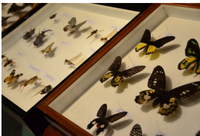
標本の作り方を解説したパンフレットも忘れずに持ち帰ろう！

3階のお勧めは昆虫標本。外国のきれいなチョウや世界一大きなセミ、昔流行った？外国産カブトムシから戸田周辺の昆虫まで約40箱を展示しています。標本箱は触れないところが多い中、ここでは手に取って見るすることができます。また自然や生きものに関する本もいっぱい。パソコンはインターネットにつながっていて調べ物にも利用できます。