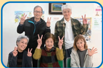
ワイワイ菜園サークルの皆さん

8人のメンバーで構成され、月2~3回集まり、妙頭寺の近くにある菜園で野菜を育てている。