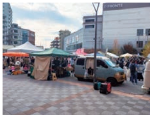
とだろコピクニック (令和5年11月開催)