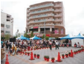
サンキューマザーフェス (令和4年5月開催)