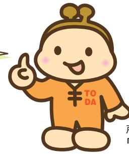
戸田市の財政案内人 「おさいふくん」

なお、数字は令和6年3月31日現在のもので、最終的な決算額とは異なります。令和5年度決算は、確定次第、市ホームページや『広報戸田市』などでお知らせします。