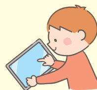
児童・生徒用タブレット