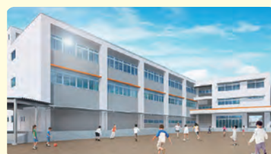
戸田南小学校増築工事の教室棟の完成イメージ(令和7年度完成予定)