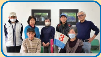
シルバーグラウンド・ゴルフ同好会の皆さん

戸田市シルバー人材センター シルバーグラウンド・ゴルフ同好会 13人のメンバーで構成され、月2回、上戸田地域交流センター（あいパル）の広場でプレーをしている。