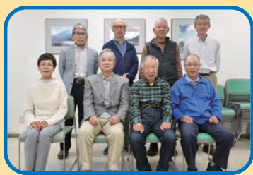
シルバー写真同好会の皆さん

21人のメンバーで構成され、月に1回の写真技術向上研修会や2カ月に1回の撮影会を実施している。