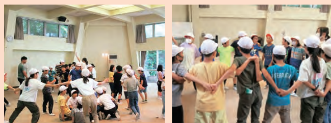
チームワークを発揮しながらアクティビティに取り組む様子