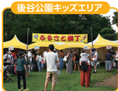
後谷公園キッズエリア