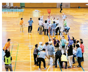
シルバースポーツ大会