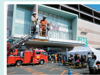
はしご車搭乗体験

*30組限定(1組2名まで、合計体重90kg以下)。午前9時30分～45分の間に整理券を配布し、定員を超える場合は午前9時50分に整理券番号で抽選を実施します