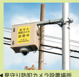
見守り防犯カメラ設置場所