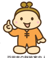
戸田市の財政案内人「おざいふくん」

市では年2回、財政状況の公表を行っています。今回は、令和3年度決算および令和4年度上半期の状況についてお知らせします。 問い合わせ 財政課（内線415）