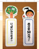
あいパルでもらえるしおり

からあいパルのキャラクターとして親しまれている「あい本(ぼん)」と、「ぼるぼるちゃん」が描かれ、バリエーションも豊富です。館内は、手づくりで温かみのあるものであふれていて、キャラクターの人形や市民がつくったあみぐるみバージョンのぼるぼるちゃんなどが皆さんを迎えてくれます。あいパルに遊びに行った時は、館内の手づくり作品にも注目してみてください。