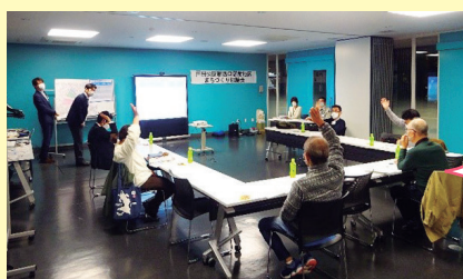
令和2年11月に行われた協議会の様子

まちづくりの検討は、地区内に住む方や事業者、土地や建物を所有する方で組織する「戸田公園駅西口駅前地区まちづくり協議会」が中心となり進めています。本地区のまちづくりに関心のある方は、まちづくり推進課までご連絡ください。