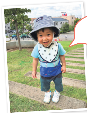
こどもの国 デビュー!