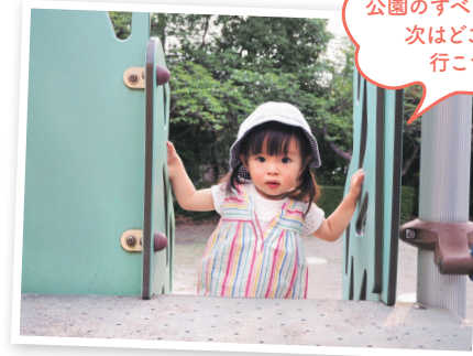
公園のすべり台が大好き! 次はどこ公園に 行こうかな♪