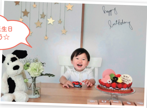
2歳のお誕生日 おめでとう☆