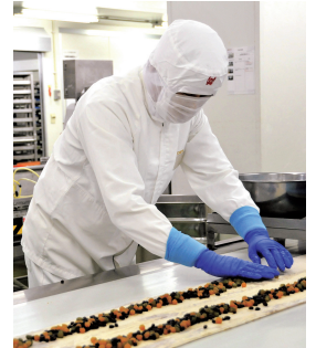
市長がパンの製造過程の一部を体験！